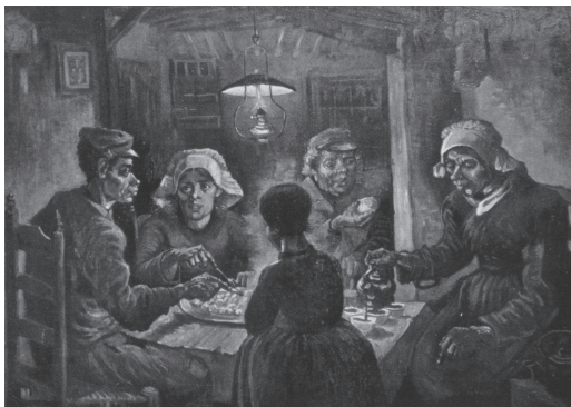
Βαν Γκογκ, Οι πατατοφάγοι , 1885, Μουσείο Βαν Γκογκ, Άμστερνταμ. Σκηνή από τη σκληρή ζωή των ανθρακορύχων του 19ου αιώνα.

Από την αρχαιότητα κιόλας πολλοί στοχαστές ασχολήθηκαν με την οργάνωση και τη λειτουργία των κοινωνικών ομάδων, των πόλεων, και αναζήτησαν τα αίτια της φτώχειας, των πολέμων κτλ. Οι πιο γνωστοί είναι ο Πλάτωνας, ο Αριστοτέλης, ο Ξενοφώντας, ο Θουκυδίδης, ο Πλούταρχος, οι σοφιστές. Όμως, παρά το αξιόλογο έργο τους, η συστηματική επιστημονική μελέτη της κοινωνίας και των κοινωνικών φαινομένων ξεκινά πριν από 150 περίπου χρόνια, στα μέσα του 19ου αιώνα. Πριν τον 19ο αιώνα έχουμε αναπτυγμένο τον κοινωνικό στοχασμό, σκέψεις πάνω στο ποια είναι η φύση του ανθρώπου, πώς πρέπει να οργανωθούν καλύτερα η οικονομία, η κοινωνία και η πολιτεία. Όμως αυτός ο στοχασμός δεν είναι επιστημονική ανάλυση της κοινωνίας. Η προσπάθεια επιστημονικής ανάλυσης της κοινωνίας ξεκινά ουσιαστικά τον 19ο αιώνα και μέσα από την ανάπτυξή του προκύπτει η επιστήμη της Κοινωνιολογίας.