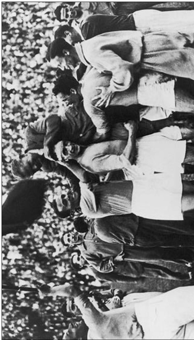
1934: Οι παίκτες της Εθνικής Ιταλίας σπκώνουν στα χέρια τον προπονητή τους Βιτόριο Πίotso.