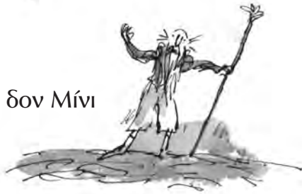
Ο δον Μίνι